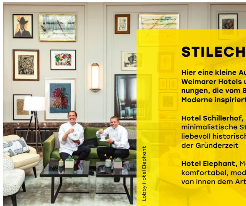
Lobby Hotel Elephant

Das Weimarer Fassadenfestival erweckt in diesem Jahr die Fassade des Bauhaus-Museums Weimar zum Leben, indem es der Frage nach dem Wert der Kunst in Zeiten von künstlicher Intelligenz und beliebiger Reproduzierbarkeit nachgeht.