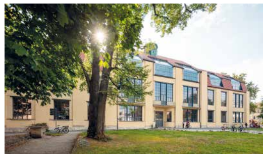
HAUPTGEBÄUDE DER BAUHAUS-UNIVERSITÄT WEIMAR

April bis Oktober: Mi, Fr und Sa 14 Uhr | November bis März: Fr und Sa 14 Uhr Kleiner Spaziergang: 1,5 Stunden | Großer Spaziergang: 2,5 Stunden Treffpunkt: Bauhaus-Atelier, Geschwister-Scholl-Straße 6a Tickets im Bauhaus-Atelier und in der Tourist-Information Weimar