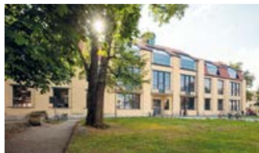
BÂTIMENTS PRINCIPAUX DE L'UNIVERSITÉ BAUHAUS DE WEIMAR

D'avril à octobre : les mercredi, vendredi et samedi à 14h00 De novembre à mars : les vendredi et samedi à 14h00 Petite visite en Allemand : durée 1h30 | Grande visite en Allemand : durée 2h30 Point de départ : Bauhaus.Atelier, Geschwister-Scholl-Straße 6a | Tickets au Bauhaus.Atelier et à l'Office du Tourisme | Tours en groupes en Anglais sur demande