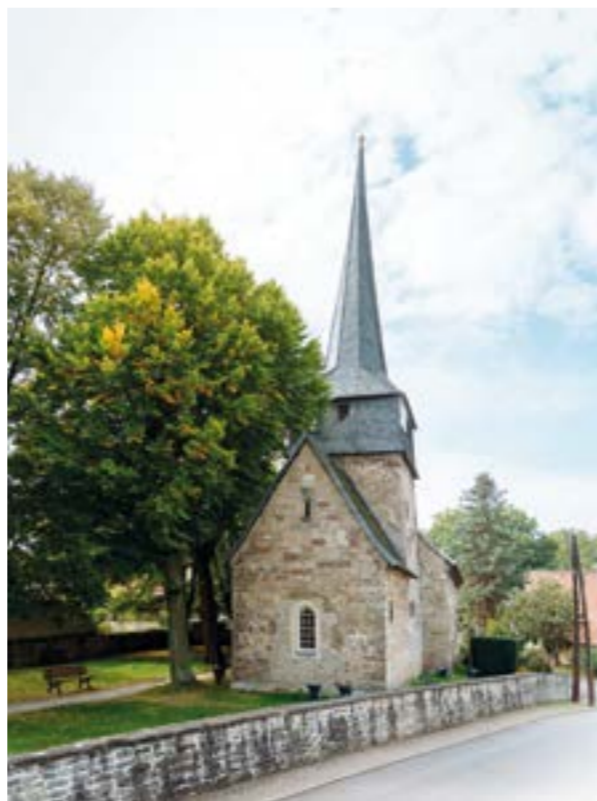
ÉGLISE DE FEININGER, GELMERODA

Départ : Bâtiment principal de l'université du Bauhaus de Weimar, Geschwister-Scholl-Straße 8