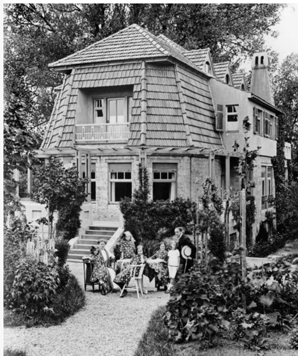
Henry Van de Velde en zijn gezin voor hun villa “Hohe Pappeln” · 1912