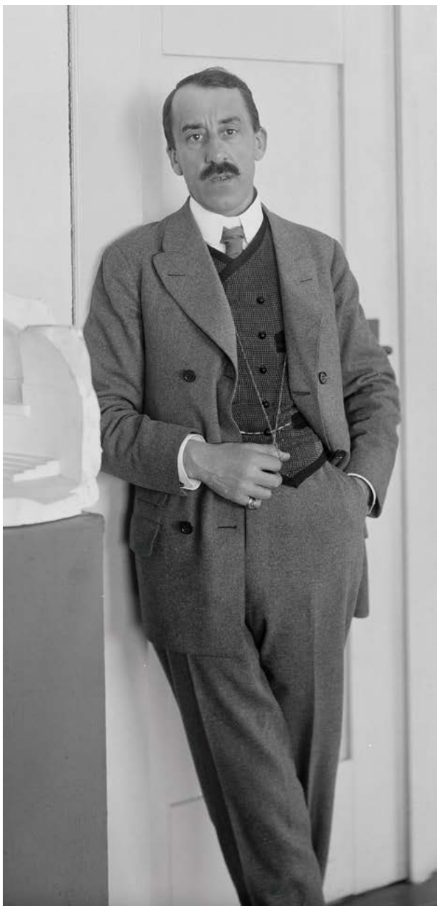
Henry Van de Velde · 1907|08