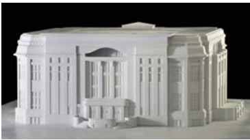
Model voor het algemene museum voor Erfurt ENSAV - LA CAMBRE, BRUXELLES

Vanuit Weimar strekte Van de Veldes bedrijvigheid zich zowel uit naar de directe omgeving als naar verre uithoeken van het Europese continent. Zo schiep hij onder andere in Jena met de "Tempietto" ter ere van de fysicus en sociaal hervormer Ernst Abbe in 1911 de "ruimtelijke sculptuur" van een modern monument. Daarnaast horen ook Villa Esche in Chemnitz (1902|11) en Villa Schulenburg in Gera (1913|14), tot de handvol totaalkunstwerken van Van de Velde die tot op heden bewaard zijn gebleven. Verder heeft de pottenbakkers-stad Bürgel haar ontwikkeling