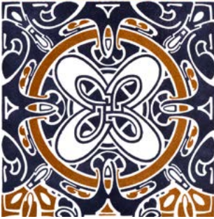
Henry Van de Velde · ornament voor het prachtexemplaar van "Zarathustra" · 1908

Terwijl het continent rond 1900 grote veranderingen doormaakt, weet één Belg de aandacht van de hele kunstwereld op zich te vestigen: Henry Van de Velde. Als