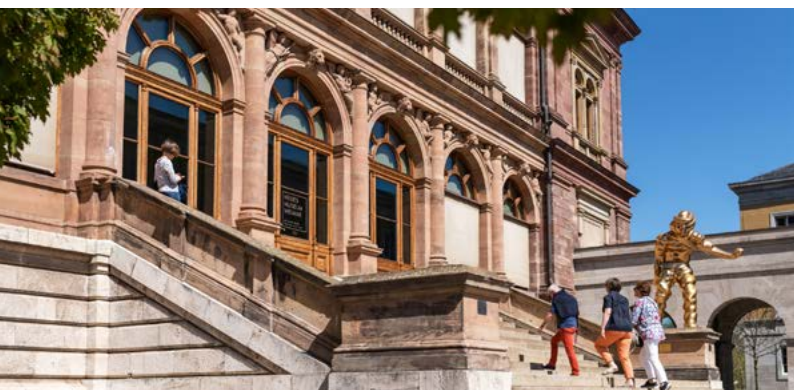
Museum Neues Weimar .....

Rondleiding met gids — Het museum toont Van de Veldes bedrijvigheid in Weimar. Middels schilderkunst, beeldhouwkunst en design ontdekt men zijn klanten en partners. De ontwikkeling richting het latere Bauhaus wordt aan de hand van meerdere filmpjes verduidelijkt. Dompel je zintuigen onder in een waar “Gesamtkunstwerk”!