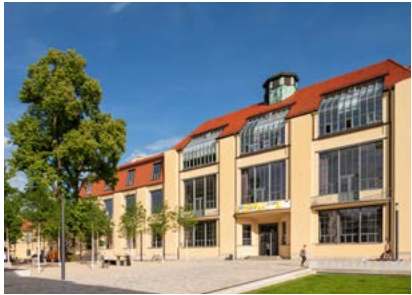
Bauhaus-Universität Weimar, voormalige Kunstschool

zich over heel Europa uitstreckte. Voorop staan beide uitzonderlijke gebouwen van de hogeschool voor toegepaste kunst (1904|11), die vandaag de dag de hoofdlocatie van de Bauhaus universiteit in Weimar vormen en sinds 1995 deel uitmaken van het UNESCO werelderfgoed. Van de Veldes carrière in Weimar begon echter hoofdzakelijk met het ontwerpen van wooncomplexen. Enkele prominente opdrachtgevers waren Elisabeth-Förster-Nietzsche en Harry Graf Kessler en ook de schrijvers Max von Münchhausen, Alfred von Nostitz en Else von Guaita-Lampe.