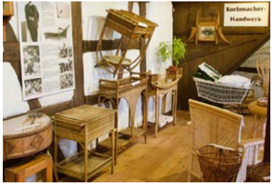
Uit riet gevlochten meubels

De Heimatverein Tannroda e.V. runt het museum op vrijwillige basis. Het museum is van april tot oktober in het weekend en op feestdagen geopend en daarnaast op afspraak.