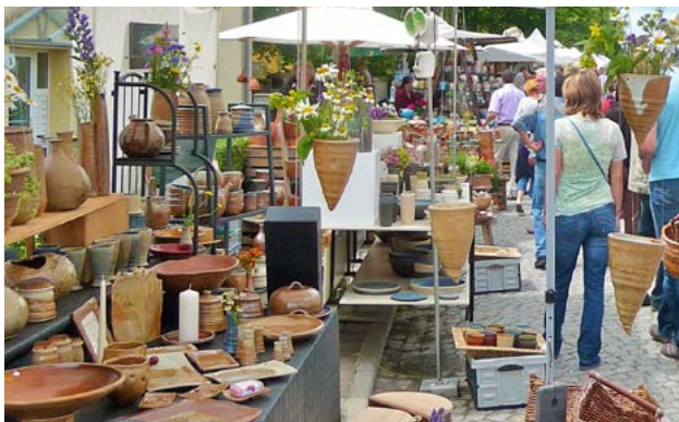
Indrukken van de pottersbakkersmarkt in Bürgel .....

De hoge concentratie van ambachtelijke pottenbakkerijen in de gemeente Bürgel, is uniek. Het vroeger al geliefde blauw-wit keramiek wordt hier nog altijd gemaakt en uitgebreid door een divers palet van nieuwe decoraties en vormen.