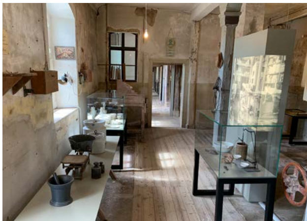
Gipsgieterei. Inkijkje in de voormalige Bauhaus-pottenbakkerij in Dornburg .....