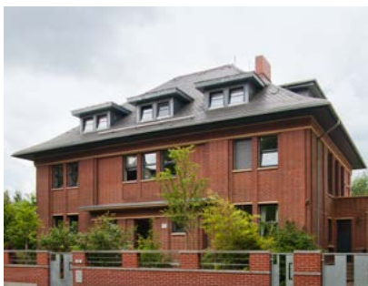
Villa Halpert .....