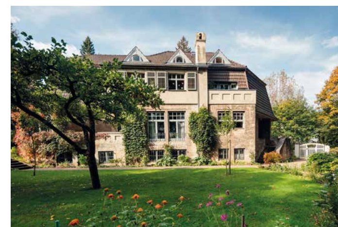
DOM POD TOPOLAMI