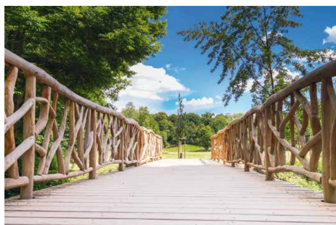
MOST NATURALNY W PARKU NAD ILMEM

W jego południowej części znajduje się barokowa rezydencja letnia Belvedere z oranżerią, ogrodem przyjemności i labiryntem, do której można dotrzeć pieszo lub na rowerze. Idąc dalej w dół rzeki otoczonej zielonymi łąkami i majestatycznymi koronami drzew, dojdziemy do parku zamkowego Tiefurt.