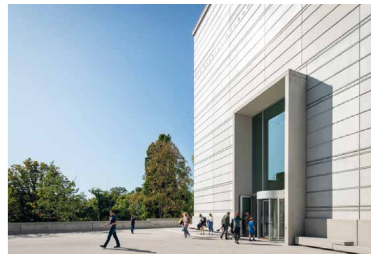
MUZEUM BAUHAUSU W WEIMARZE