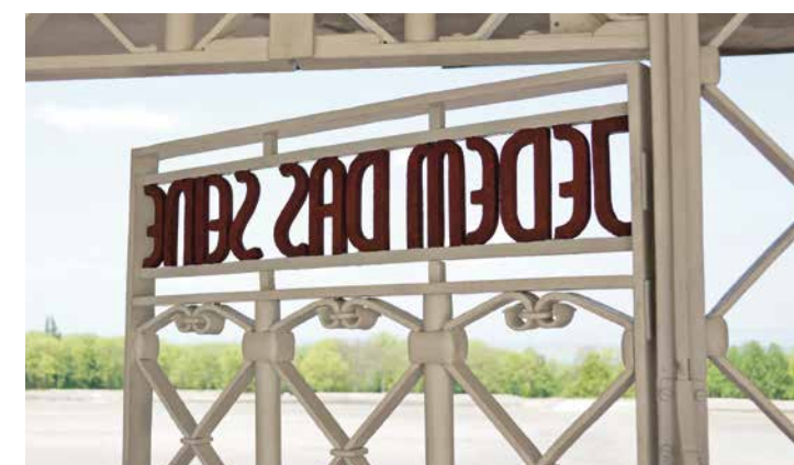
MIEJSCE PAMIĘCI OBOZU BUCHENWALD

Liberalne, demokratyczne idee Republiki Weimarskiej miały swojego przeciwnika w nacjonalistyczno-totalitarnej ideologii, której zwycięstwo na arenie politycznej miało okazać się dramatyczne w skutkach. Przemoc i zbrodnie przypominają dziś miejsce pamięci znajdujące się na terenie dawnego obozu koncentracyjnego Buchenwald na wzgórzu Ettersberg. Corocznie przybywa tu około 500 000 zwiedzających z całego świata, aby uczcić pamiętkę zmarłych. Wystawa stała w budynku magazynu dawnego obozu koncentracyjnego w poruszający sposób przedstawia jego dzieje na przykładzie wielu osobistych historii.