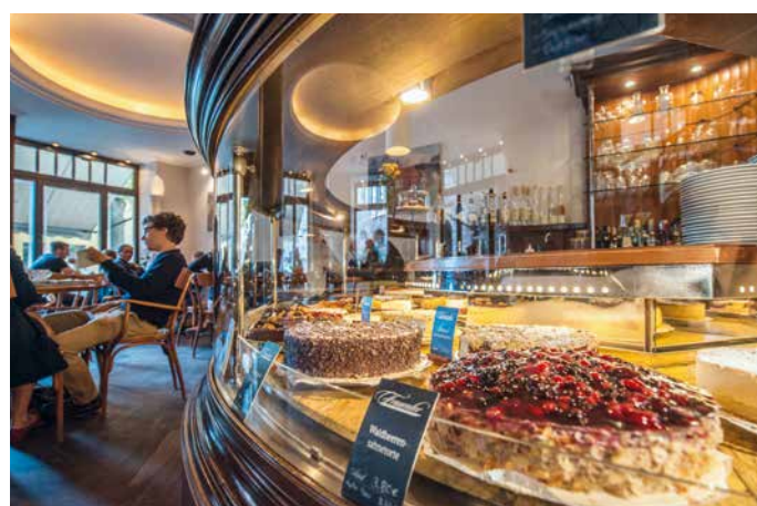
WYBÓR CIAST W KAWIARNI FRAUENTOR