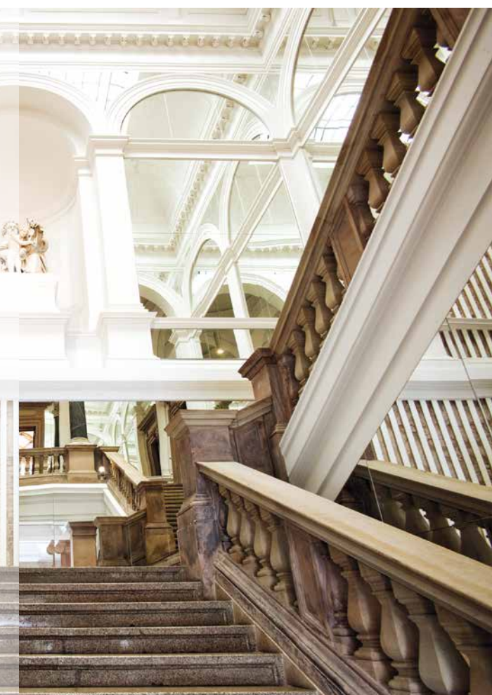
MUZEUM NEUES WEIMAR