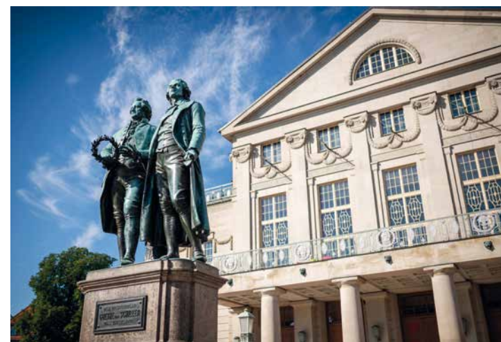
POMNIK GOETHEGO I SCHILLERA PRZED NIEMIECKIM TEATREM NARODOWYM W WEIMARZE

Od lekkich muz po wielką sztukę – w tym mieście każdy znajdzie coś dla siebie. Niemiecki Teatr Narodowy w Weimarze należy do najznakomitszych teatrów w Niemczech i cieszy się międzynarodowym uznaniem. Weimarska Orkiestra Miejska to najwyższej klasy zespół muzyczny, popularny również poza granicami Turynii. W Weimarze odbywają się też coroczne Turyngeńskie Tygodnie Bachowskie, będące największym festiwalem muzyki barokowej na świecie. Weimarskie lato obfituje w wydarzenia kulturalne: przedstawienia teatralne na scenach małych i dużych, koncerty w salach koncertowych i pod gołym niebem, lekkie muzy i kreatywne występy. W Weimarze występują zarówno głośni, renomowani artyści, jak i młodzi twórcy z talentem.