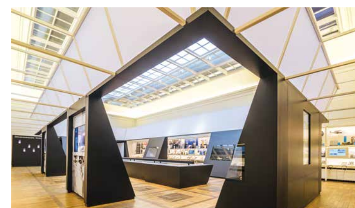
DOM REPUBLIKI WEIMARSKIEJ