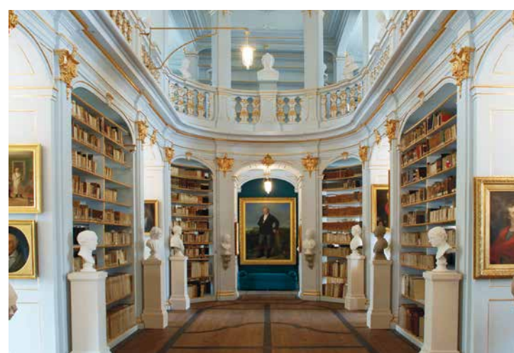
BIBLIOTEKA KSIĘŻNEJ ANNY AMALII