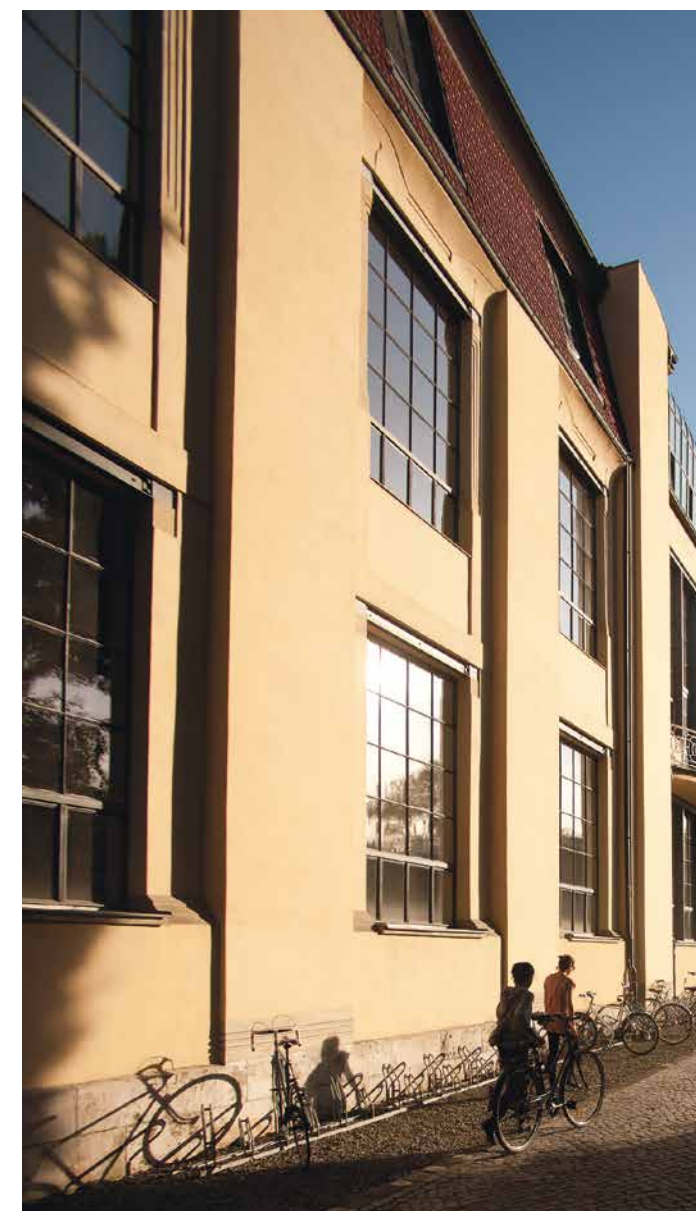
BAUHAUS-UNIVERSITÄT W WEIMARZE, GMACH GŁÓWNY AUTORSTWA HENRY'EGO VAN DE VELDE