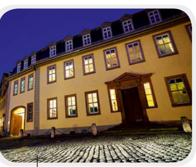
Goethes Wohnhaus am Frauenplan

Das 1709 erbaute Haus am Frauenplan hat Johann Wolfgang von Goethe bis zu seinem Tod 1832 nahezu fünfzig Jahre lang bewohnt; zunächst als Mieter, später als Eigentümer. In den Arbeitsräumen Goethes ist die Ausstattung unverändert erhalten geblieben. Zu besichtigen sind neben den Wohnräumen Goethes und seiner Frau Christiane auch das Arbeitszimmer, die Bibliothek sowie die Empfangsräume.