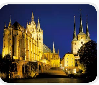
Dom St. Marien und St. Severikirche

Das eindrucksvolle Kirchenbauensemble von Dom St. Marien und St. Severikirche befindet sich im Herzen der Altstadt und beherbergt die größte freischwingende mittelalterliche Glocke der Welt, die „Gloriosa“. Alljährlich im Sommer werden die 70 Stufen während der DomStufen-Festspiele zu einer der schönsten Open-Air-Festivalbühnen Deutschlands.