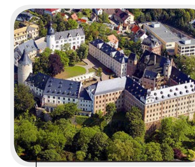
Residenzschloss Altenburg mit Spielkartenmuseum

Auf einem Porphyrfelsen thront das Residenzschloss mit dem Schloss- und Spielkartenmuseum. Von der einstigen Pfalz des Stauferkaisers Barbarossa entwickelte sich die Burg zur Residenz der Wettiner Fürsten. Heute laden interessante Sammlungen und Sonderausstellungen in die prächtigen Räume ein. Besonders sehenswert sind die Schlosskirche und die prunkvollen Säle.