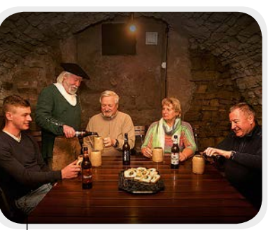
Geraer Höhler Gera

Seit dem 16. Jahrhundert wurde in Gera und Bad Köstritz Bier gebraut. Das köstliche Gebräu erforderte eine entsprechende Lagerung in tiefen Kellern. So entstand ein unterirdisches Labyrinth aus Gängen und Nischen, 5 bis 11 Meter unter der Erde – die Geraer Höhler. Einen Teil der Geraer Höhler kann man heute besichtigen.