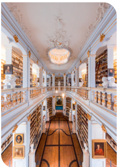
Biblioteca della duchessa Anna Amalia

Nel cuore della Germania si trova un tesoro culturale di fama mondiale: Weimar, città dei poeti, dei pensatori e dei designer. Premiata ben tre volte dall'UNESCO, unisce in modo unico il patrimonio classico, il design d'avanguardia e l'eccellenza musicale.