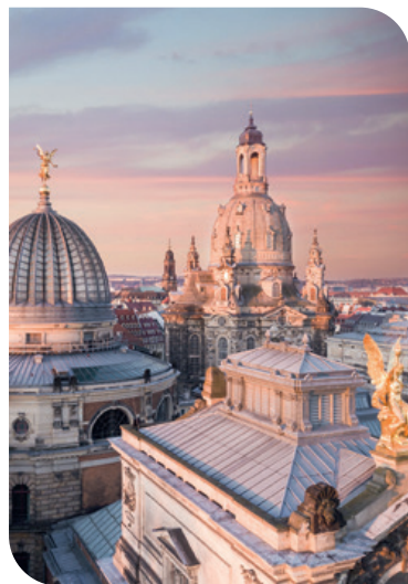
Chiesa di Nostra Signora (Frauenkirche)

Gli amanti della cultura di tutto il mondo trovano qui momenti di pura gioia: concerti di livello mondiale alla Semperoper e alla Philharmonie, impressionanti capolavori di fama internazionale negli 11 musei delle collezioni d'arte statali e la ricchezza sonora della Sächsische Staatskapelle. Festival internazionali come il Dresdner Musikfestspiele e lo Striezelmarkt, uno dei mercatini di Natale più antichi d'Europa, garantiscono esperienze indimenticabili. I vigneti della regione dell'Elba con le loro cantine, gli affascinanti castelli, palazzi e i luoghi da sogno tra la città della porcellana di Meissen e la città rinascimentale di Pirna, all'ingresso del romantico mondo roccioso della Svizzera Sassone, rendono Dresda una destinazione unica per il piacere culturale e il relax.