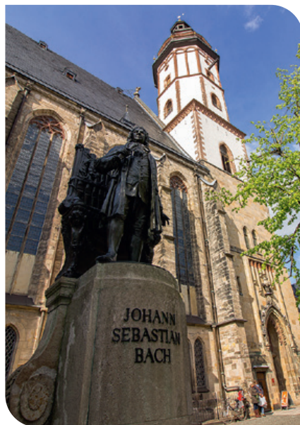
Monumento a Bach di fronte alla chiesa di San Tommaso

Gli amanti dell'arte possono assistere a una metamorfosi creativa in quella che un tempo era la più grande filanda di cotone d'Europa: oggi la "Spinnerei" è un centro d'arte contemporanea di livello internazionale. Musei, gallerie e cultura industriale conferiscono alla città un'atmosfera eccitante e creativa.