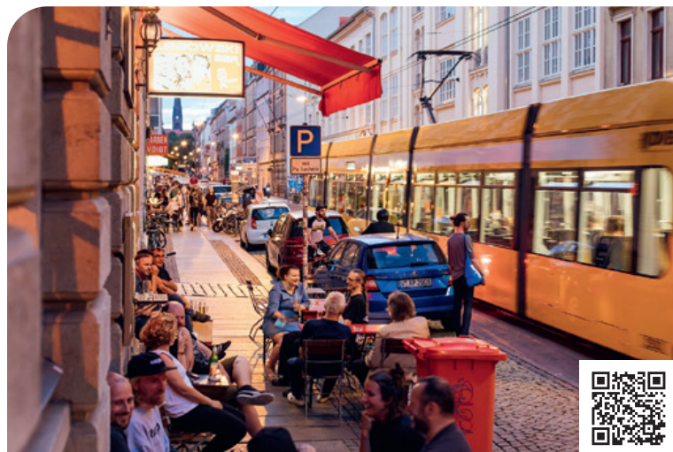
Tramonto nella Neustadt di Dresda