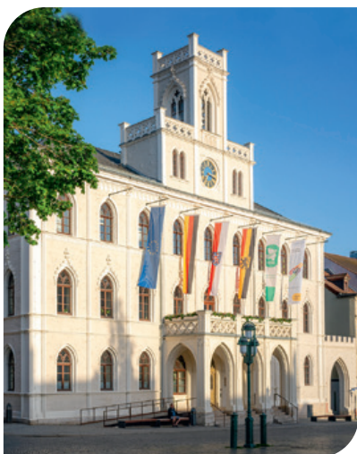
Municipio di Weimar