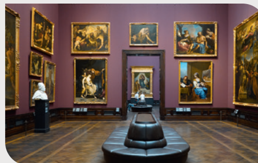
Galleria d'arte Alte Meister