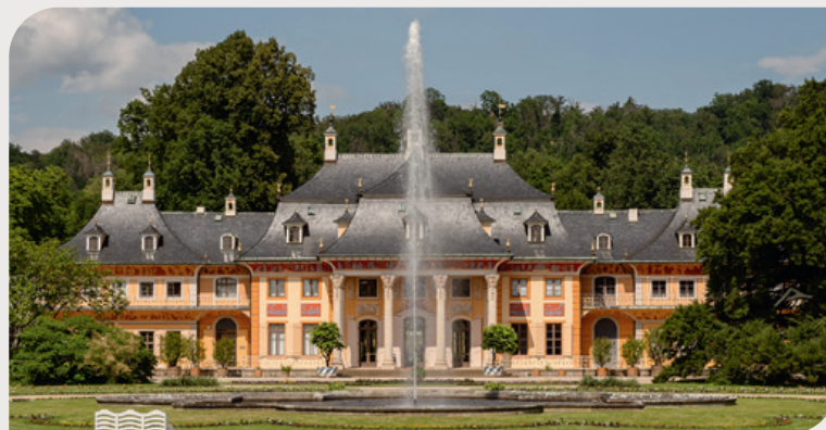
Castello di Pillnitz

● Dresda incanta con i suoi castelli famosi in tutto il mondo. Lo Zwinger barocco e il castello residenziale affascinano con la loro architettura e le loro collezioni opulente, mentre il palazzo di Pillnitz, situato direttamente sul fiume Elba, affascina con il suo stile di ispirazione cinese. Il castello di Moritzburg, immerso in un romantico paesaggio lacustre, ha fatto da sfondo a famosi film fiabeschi. Nei dintorni, l'Albrechtsburg di Meissen con il duomo gotico, il giardino barocco Großsedlitz, il castello di Weesenstein o la fortezza di Königstein sono i più famosi tra i numerosi altri castelli e fortezze signorili.