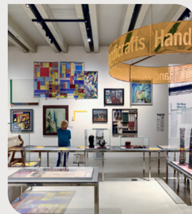
Il Museo Bauhaus di Weimar

● L'arte a Weimar è un mix stimolante di mentalità classica e avanguardia moderna. Qui le idee di Goethe e Schiller si incontrano con la radicalità creativa del Bauhaus. Il Bauhaus-Museum Weimar e il Museum Neues Weimar presentano icone del design e visioni architettoniche di un'intera epoca. Allo stesso tempo, la Weimar classica con la biblioteca della duchessa Anna Amalia, il castello cittadino e i luoghi di lavoro dei poeti invita a un viaggio artistico nel tempo. A Weimar la storia esce dai musei e vi accoglie a braccia aperte.