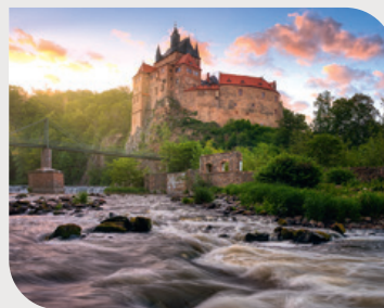
Castello di Kriebstein

● Dresda incanta con i suoi castelli famosi in tutto il mondo. Lo Zwinger barocco e il castello residenziale affascinano con la loro architettura e le loro collezioni opulente, mentre il palazzo di Pillnitz, situato direttamente sul fiume Elba, affascina con il suo stile di ispirazione cinese. Il castello di Moritzburg, immerso in un romantico paesaggio lacustre, ha fatto da sfondo a famosi film fiabeschi. Nei dintorni, l'Albrechtsburg di Meissen con il duomo gotico, il giardino barocco Großsedlitz, il castello di Weesenstein o la fortezza di Königstein sono i più famosi tra i numerosi altri castelli e fortezze signorili.