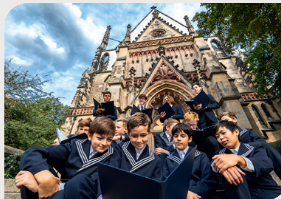
Coro di San Tommaso

● Lipsia è la città della musica. Compositori importanti come Bach e Mendelssohn hanno scritto qui i loro capolavori musicali. Con la Gewandhaus, l'Opera di Lipsia e il Coro delle voci bianche di San Tommaso, il cuore classico continua a battere a Lipsia. Con festival come il Bachfest o il Jazzfestival e una vivace scena musicale, Lipsia entusiasma con tutta la varietà della sua vivace cultura musicale.