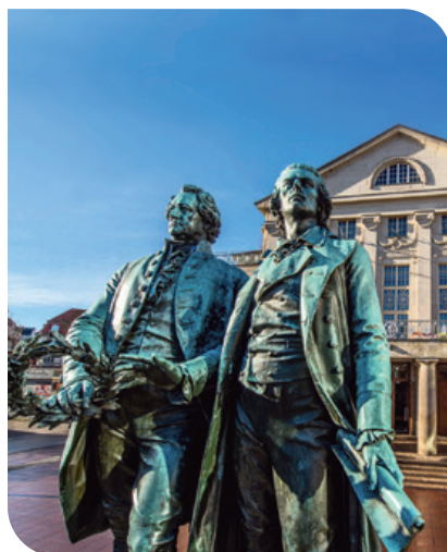
Piazza del Teatro con il monumento a Goethe e Schiller

Nel cuore della Germania si trova un tesoro culturale di fama mondiale: Weimar, città dei poeti, dei pensatori e dei designer. Premiata ben tre volte dall'UNESCO, unisce in modo unico il patrimonio classico, il design d'avanguardia e l'eccellenza musicale.