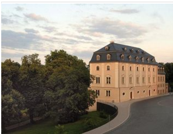
Hertogin Anna Amalia Bibliotheek