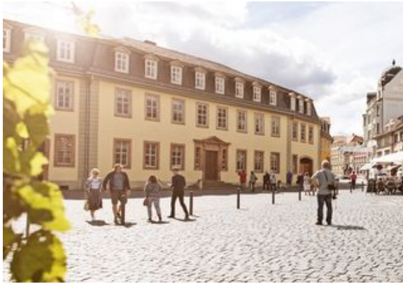
Goethe Nationalmuseum, Goethes woonhuis