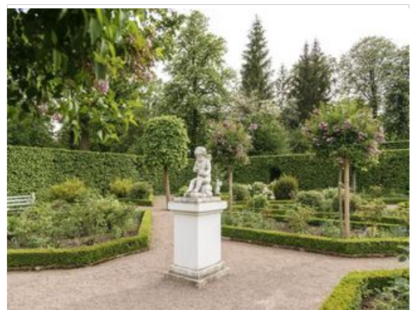
Slot Belvedere en de Russische tuin