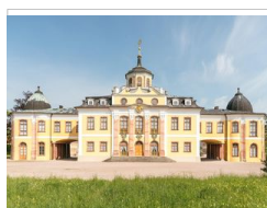
Schlösser und Parks