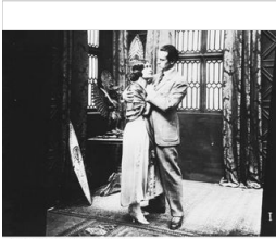
Die Spinnen - Dorothea - Regie: Fritz Lang