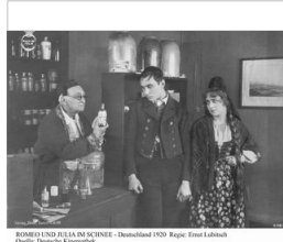
Romeo und Julia im Schnee - Deutschland 1920 - Regie: Ernst Lubitsch

Mittwoch, 02.09.2020, 19:45 Museum für Ur- und Frühgeschichte Thüringens