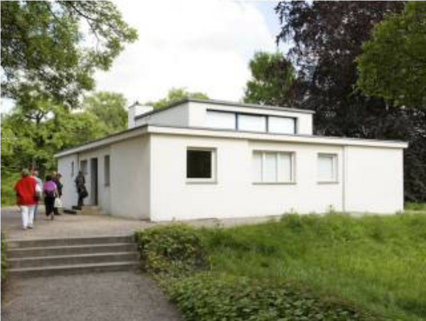
Radfahrer*innen am Haus am Horn

Eine Stadtführung per Rad zur Weimarer Avantgarde des frühen 20. Jahrhunderts