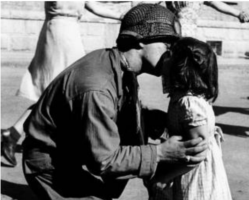
☞ "The Kiss of Liberation" (Bildausschnitt) - Tony Vaccaro Studio (Courtesy of the Monroe Gallery of Photographie)