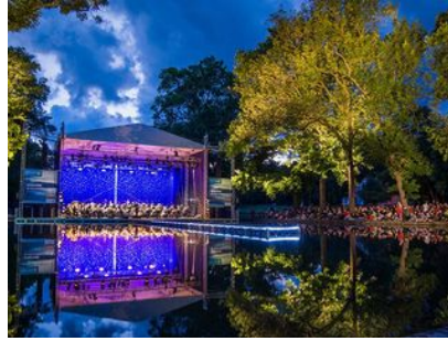
Deutsches Nationaltheater und Staatskapelle Weimar