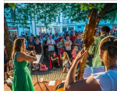
Höhepunkte im Musikjahr