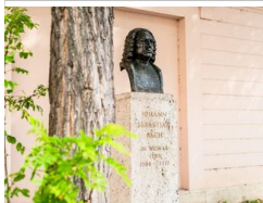
Johann Sebastian Bach

In den vergangenen Jahrhunderten machten sich zahlreiche Komponisten Weimar zur Wahlheimat. Johann Sebastian Bach prägte in der Zeit von 1708 bis 1717 das musikalische Leben und den Ruf Weimars als Musikerstadt. Ab 1848 lebte Franz Liszt als Hofkapellmeister in der Altenburg und lud die europäische Musikszene dorthin ein. Bach und Liszt - heute auf der ganzen Welt ein Begriff - waren nicht die einzigen Musiker, die sich Weimar als Schaffens- und Lebensort erwählten. Einer der berühmtesten Klaviervirtuoson seiner Zeit, der Komponist Johann Nepomuk Hummel, wirkte fast zwanzig Jahre in Weimar. Richard Strauß wiederum erlebte in Weimar eine Zeit des Reifens. Hier wurden seine Sinfonischen Dichtungen "Don Juan", "Macbeth" und "Tod und Verklärung" uraufgeführt. Die Oper "Hänsel und Gretel" von Engelbert Humperdinck erlebte 1893 mit der damaligen Hofkapelle ebenfalls ihre Uraufführung.