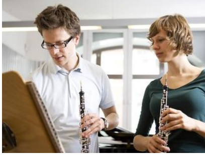
Hochschule für Musik FRANZ LISZT