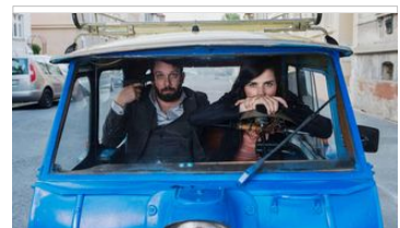
DIE HARTE KERN