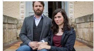
DER LETZTE SCHREY