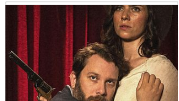
DER HÖLLISCHE HEINZ