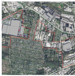
☞ Gewerbestandort West: Traditioneller Gewerbestandort an B 7/B 85 in Weimars Westen. Vertretene Branchen: Logistik, Handwerk, Dienstleistung, Handel