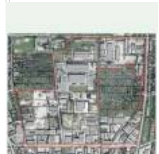
☞ Gewerbestandort "Hinter dem Bahnhof": Traditioneller Gewerbestandort nördlich des Bahnhofes zwischen Rießner Straße und Nordstraße. Vertretene Branchen: Groß- und Einzelhandel, Dienstleistungen, Büro, Recycling